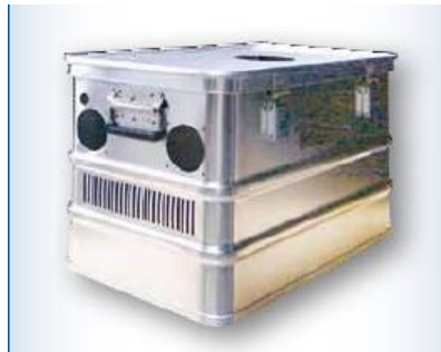
Caja de transporte doméstica para el sistema de humidificación.