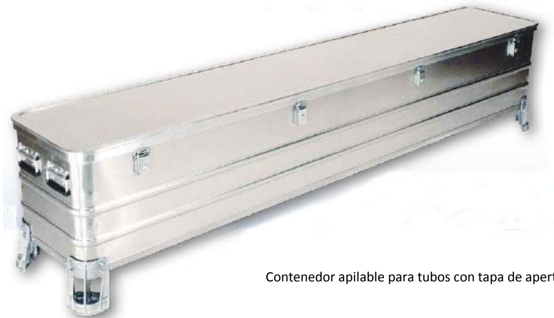
Contenedor apilable para tubos con tapa de apertura total