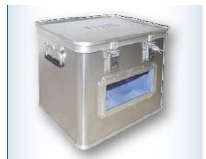
Caja de transporte de cilindros con foam y con ventana para inspección