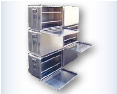
Cajas de transporte apilables formando un conjunto para bienes humanitarios

He aquí algunos ejemplos de nuestras soluciones personalizadas: