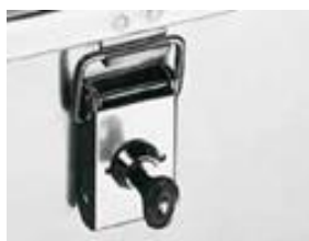
Cerradura de cilindros